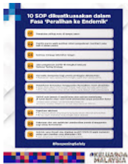
SOP Endemik 01042022.jpg 123K